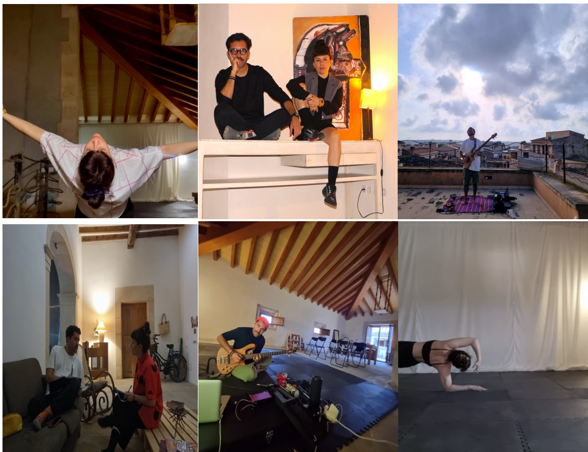
Fotografías Residencia Can Timoner, Santanyi. Obra Ecología de Saberes e investigación Dignidad